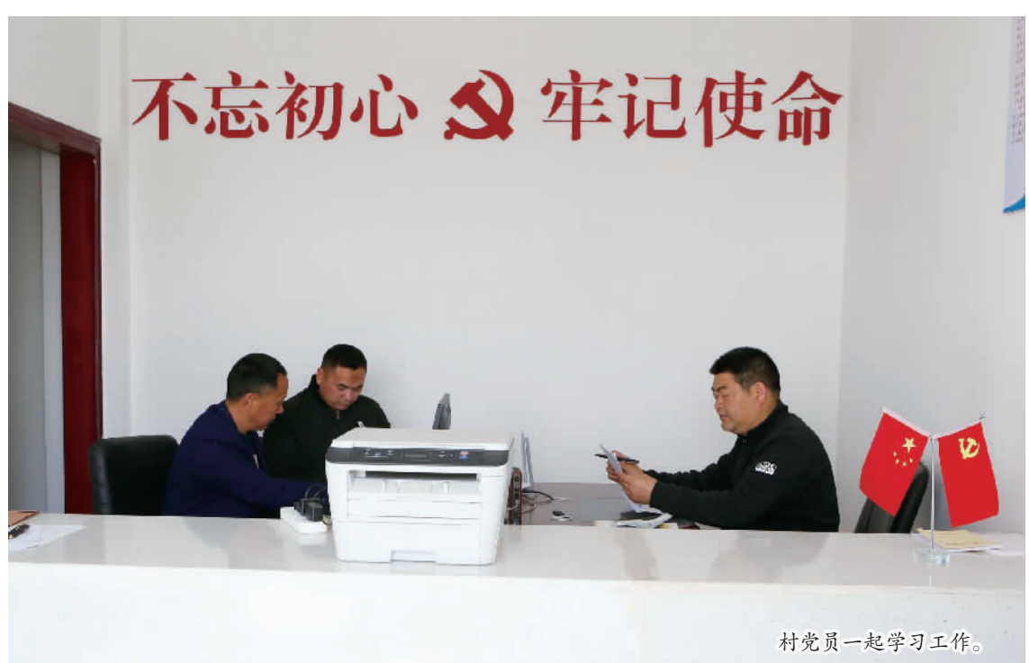
村党员一起学习工作。