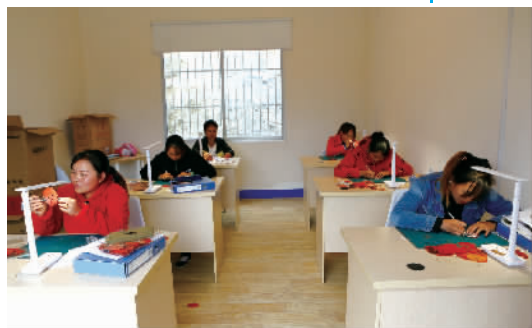
红叶叶雕工作室的雕刻“大师”。