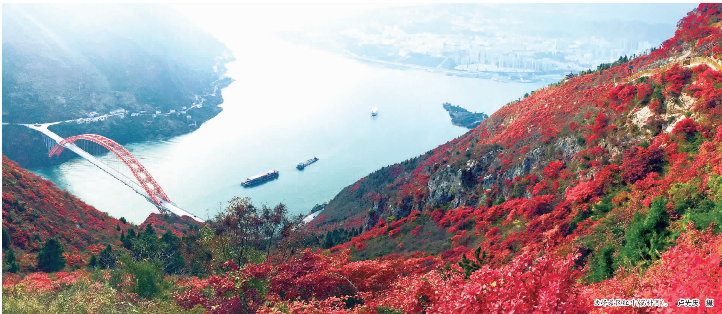
巫山景区红叶(资料图)。