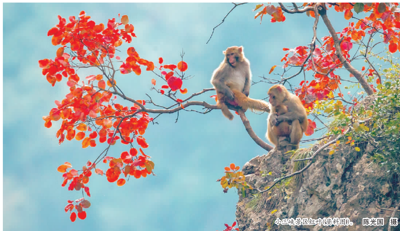
小三峡景区红叶(资料图)。