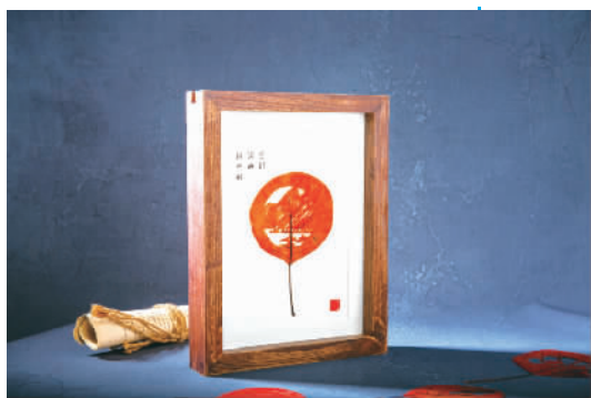
红叶叶雕——村民增收致富的“金叶子”。