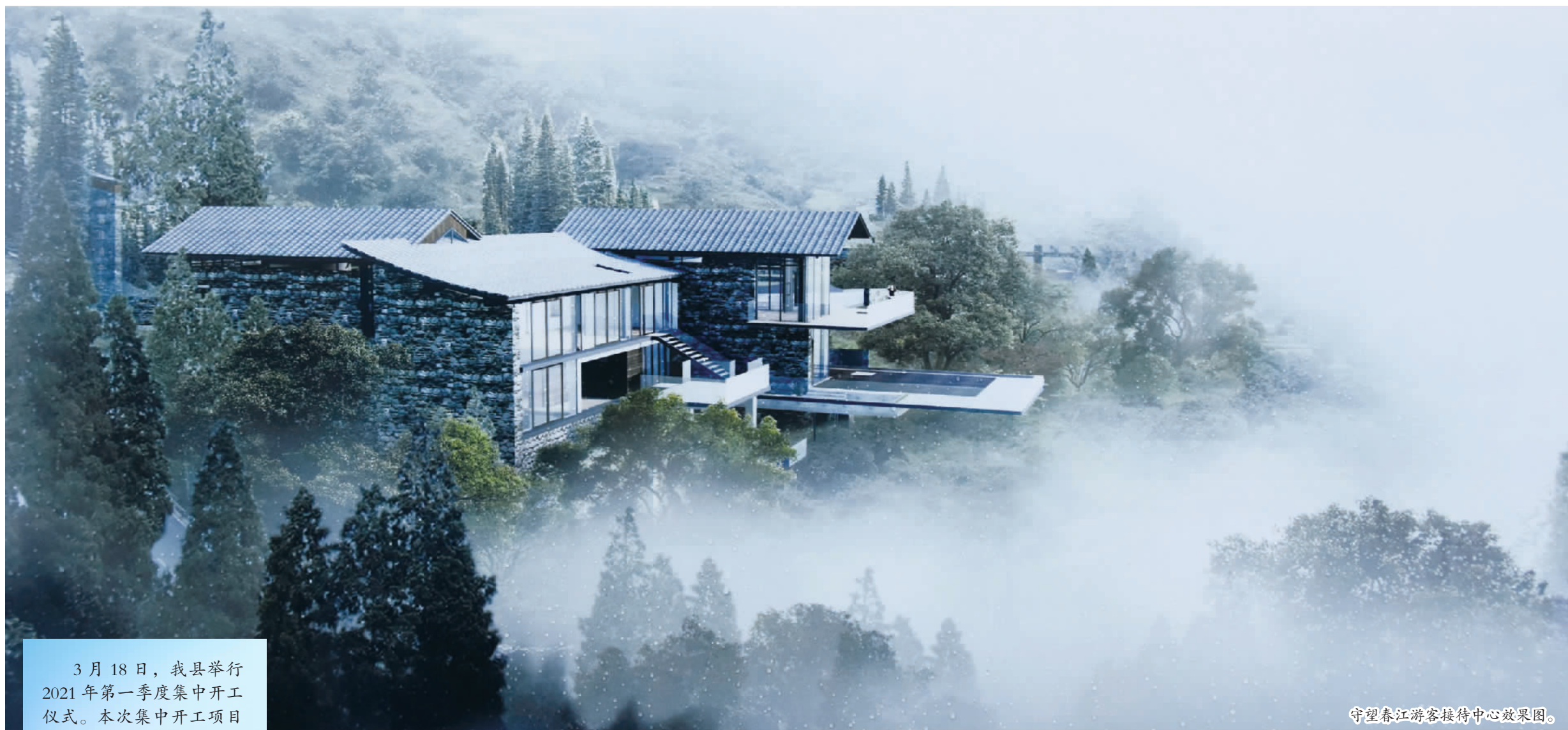
守望春江游客接待中心效果图。

3月18日,我县举行2021年第一季度集中开工仪式。本次集中开工项目34个,总投资53.7亿元。共设4个开工会场,分别为春泉至龙雾旅游公路项目、两坪乡溪沟岸线环境综合整治工程、鸿泰·龙门汇、巫峡·神女景区AAAAA创建提升工程。