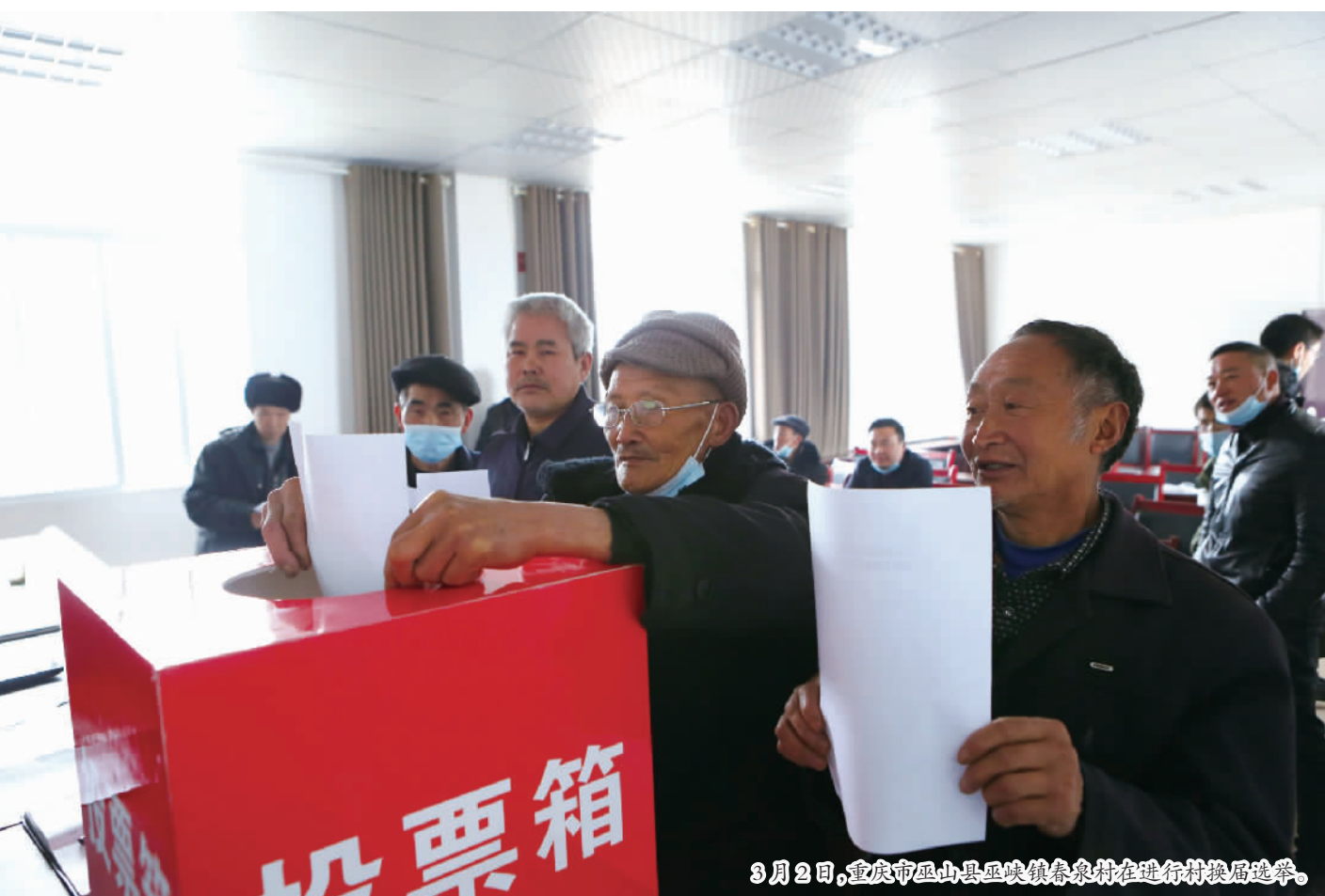
3月2日,重庆市巫山县巫峡镇春泉村在进行村换届选举。