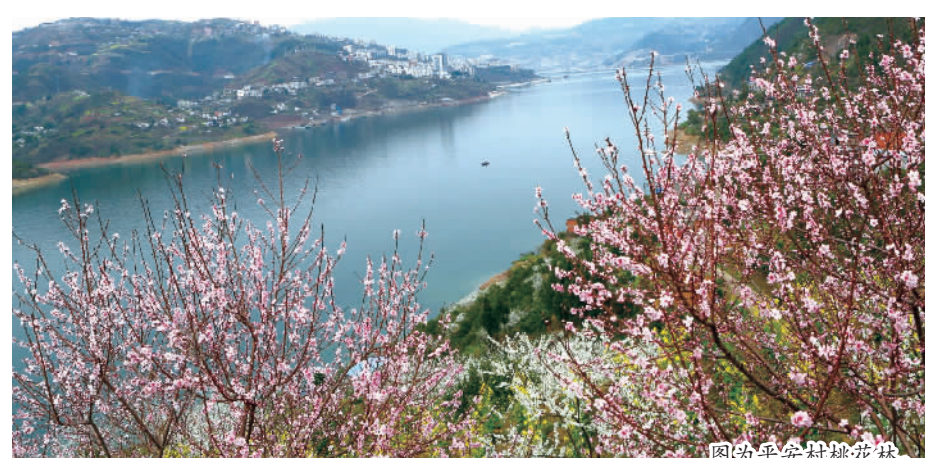
图为平安村桃花林。

据了解,东岗村赏桃花,一直是市民踏青游玩的好去处。近年来,由于产业发展和果树收益对比,村民们逐渐淘汰了桃树,栽上了