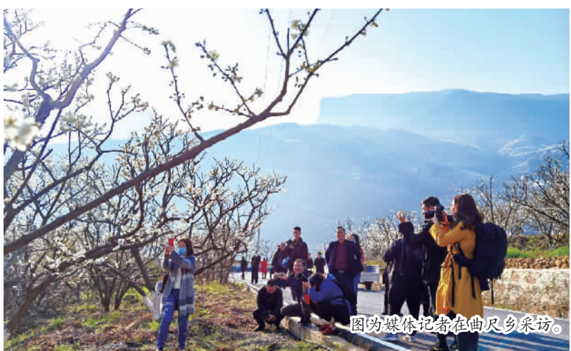
图为媒体记者在曲尺乡采访。

本报讯(记者 方丹 肖乔文/图) 3月3日,第三届长江三峡(巫山)李花节暨三峡李院开园仪式新闻发布会在巫山县融媒体中心演播大厅举行。副县长黄勇、刘海燕诚邀广大游客到巫山,游三峡画廊、赏百里李花、住三峡李院。