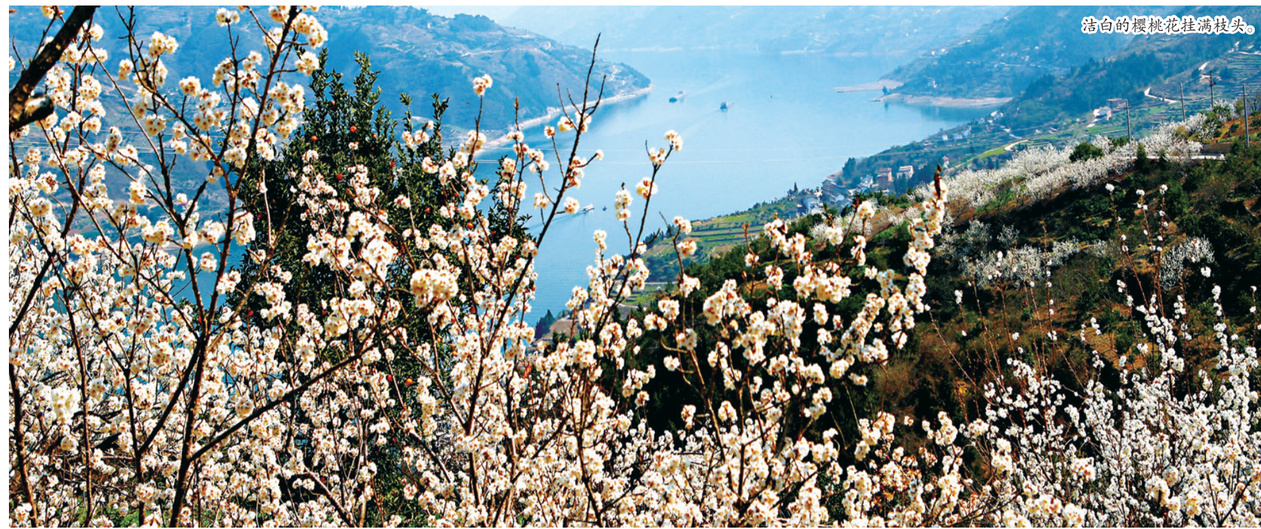
洁白的樱桃花挂满枝头。