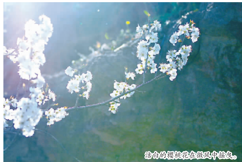
洁白的樱桃花在微风中摇曳。

本报讯（记者 卢先庆 向勇文/图）2021年2月19日，随着气候变暖，位于大溪乡长江岸边的2000多亩樱桃花正在怒放。满山遍野的樱桃花，把长江两岸的春天装扮成了童话世界，显得绚丽多姿、春意盎然。同时，樱桃花还吸引了周边游客前来游玩，感受春花烂漫的世界和浩浩长江奔腾在绿水青山中的壮阔美景。