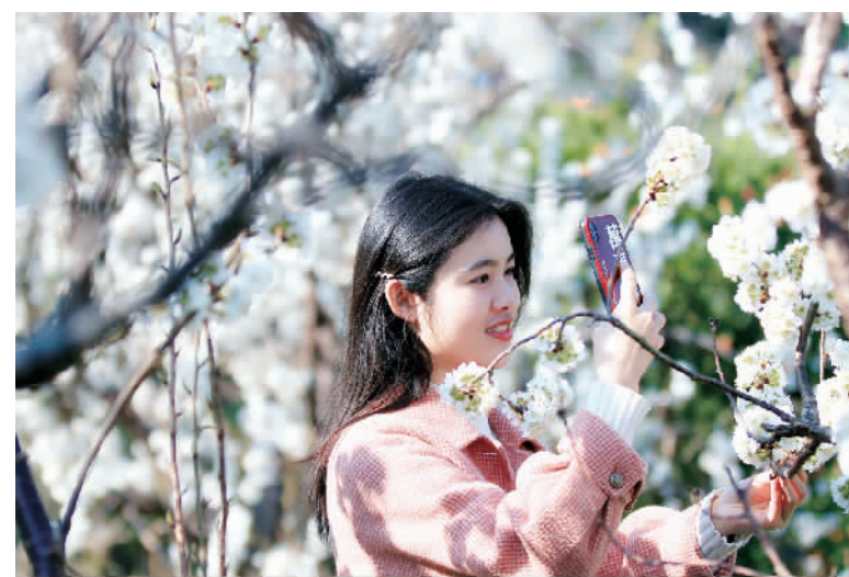
游客在樱桃花中留影。

“趁着春色正浓，可别错过花期。”大溪乡乡长李养兵告诉记者，现在大溪乡基本实现农业产业结构调整乡村旅游的格局，通过大力发展乡村旅游产业，借助大溪文化、节孝坊、曹家老屋、狮子岩森林公园等历史文化及自然资源，走“农—文—旅融合”发展之路，已实现“春赏樱花、夏采草莓脆李、秋摘葡萄、冬摘柑橘”的乡村旅游格局，全年可接待游客3万人次，实现乡村旅游产值200余万元。