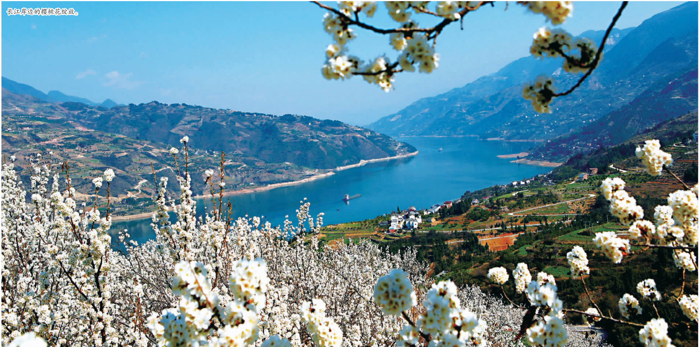
长江岸边的樱花绽放。