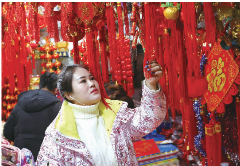
市民选购春节饰品。