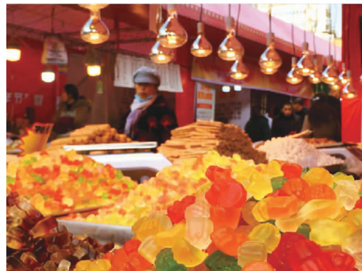
市民在商场购买糖果。卢先庆 摄