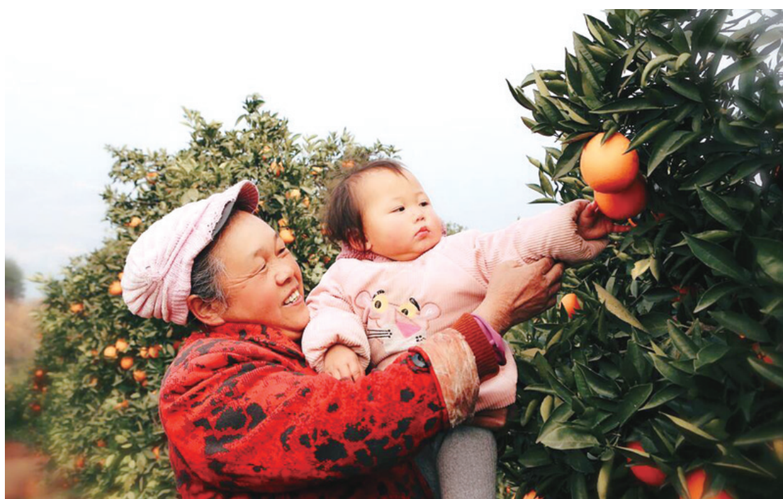
过年少不了的巫山恋橙。