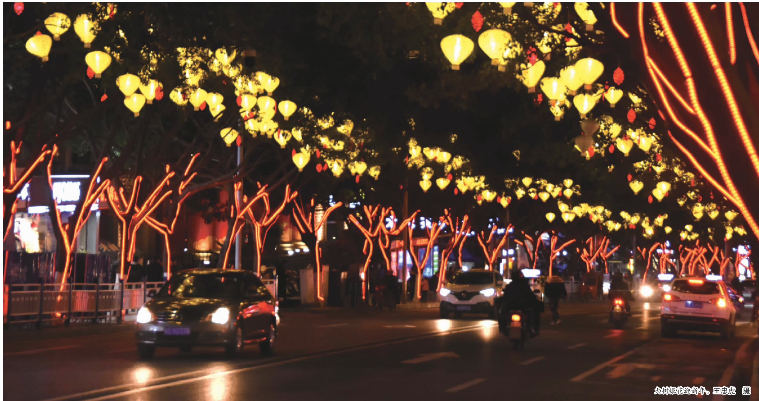
炎村银花迎新。