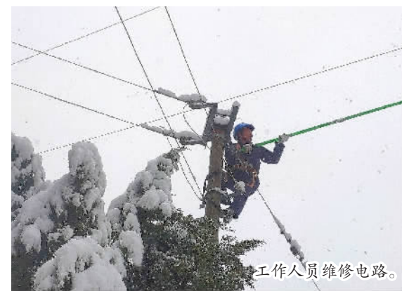
工作人员维修电路。

本报讯 (记者 侯月) 为保障春节期间供电工作,国网巫山供电公司提前制订预案、加强巡查、开展配变增容等多项举措,确保百姓用电万无一失。