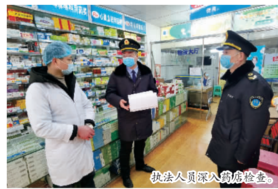
执法人员深入药店检查。

本报讯 (记者 杨新宇 文/图) 1月19日,县卫生健康委与市场监管局对辖区内诊所、药店、商超的新冠肺炎疫情防控工作进行联合督导检查。对进入经营场所顾客的测温、扫码、佩戴口罩等工作落实情况进行现场督导。