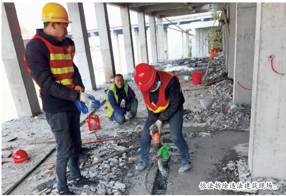
依法拆除违法建筑现场。

本报讯 (记者 曾露文/图) 1月17日,县查违办、县规划自然资源局、县林业局联合巫峡镇,对位于巫峡镇南陵社区长江大桥南桥头处的3处违法建筑,依法予以拆除。截至目前,拆除工作正在有序进行。