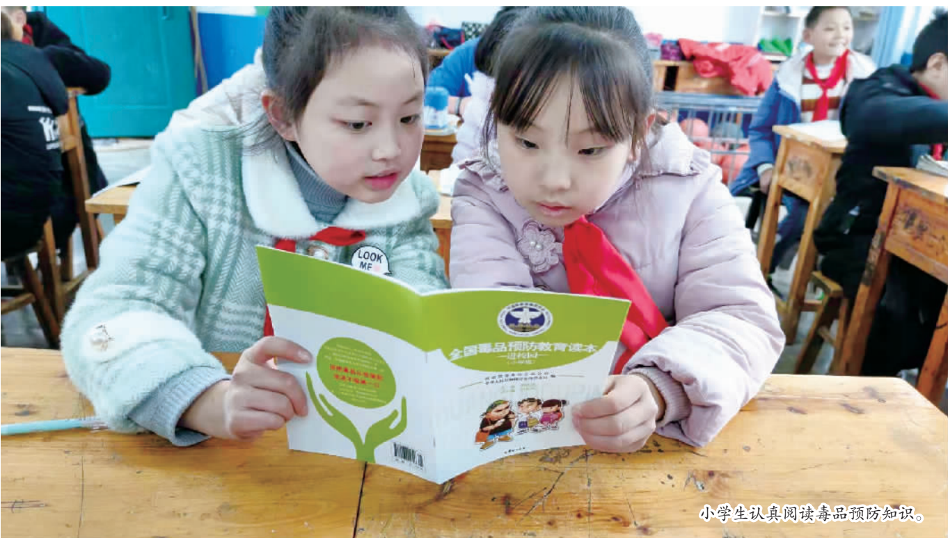
小学生认真阅读毒品预防知识。